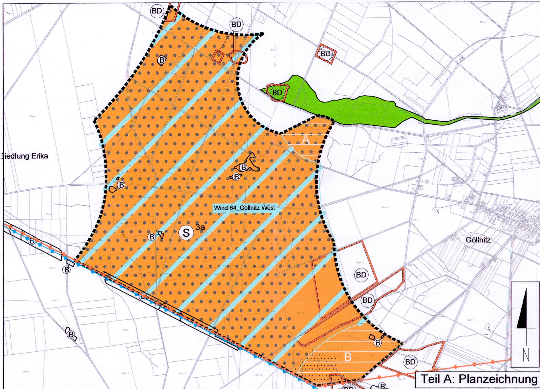
Teil A: Planzeichnung