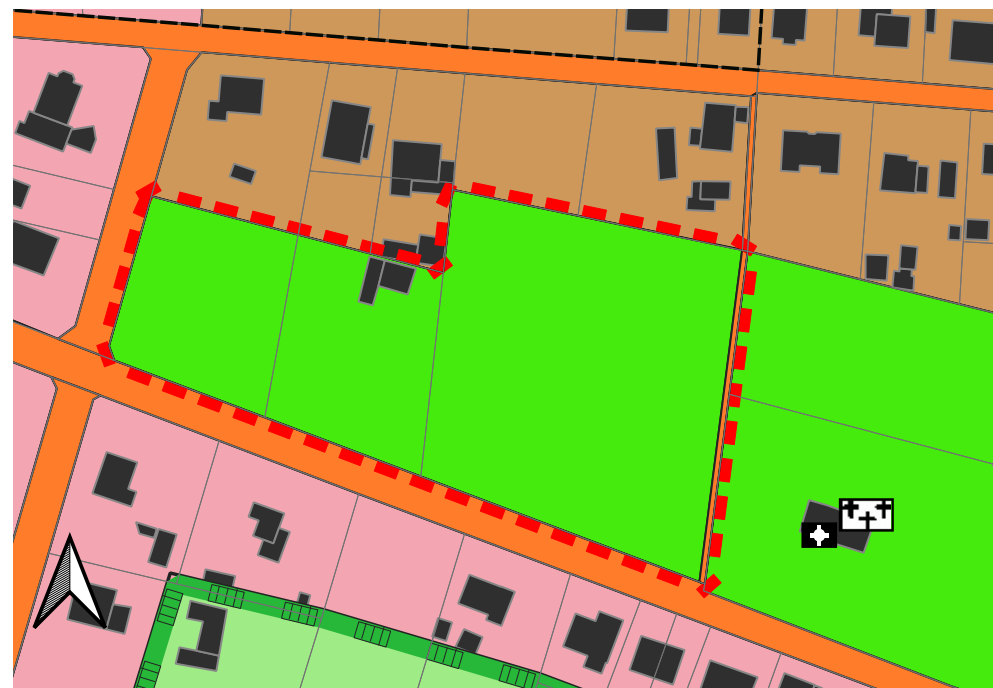
Flächennutzungsplan Amt Kleine Elster, Kartengrundlage: WMS BB ALKIS