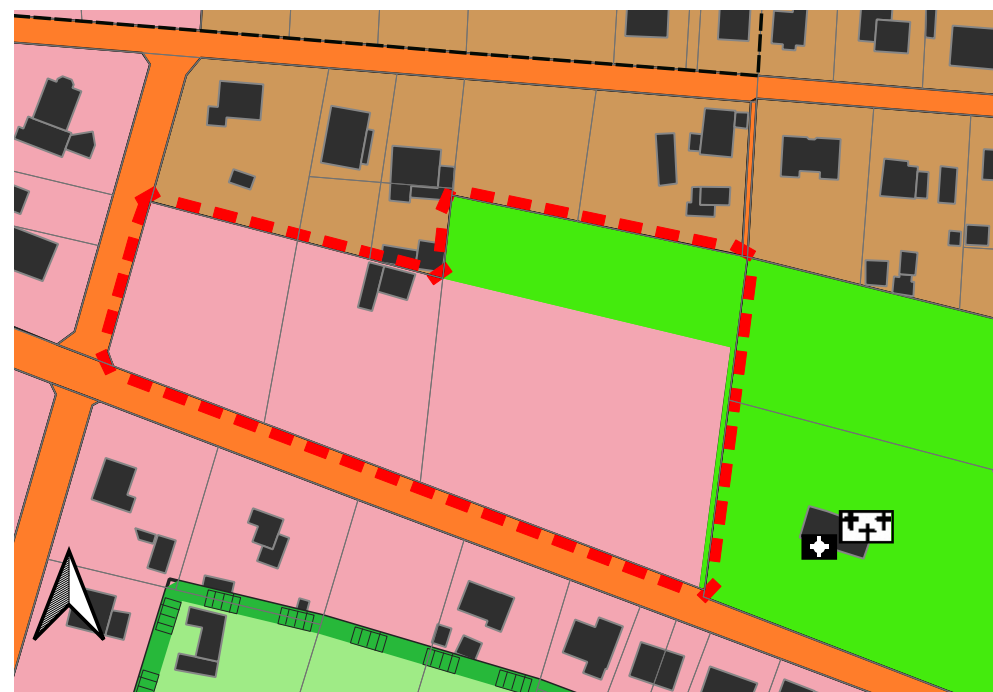
18. Änderung des Flächennutzungsplans Amt Kleine Elster, Kartengrundlage: WMS BB ALKIS