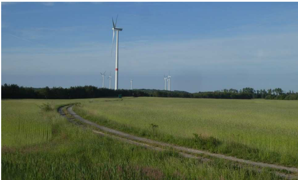
Foto 1. Unter den Windenergieanlagen (WEA) des Windparks Klettwitz III wurde im Frühjahr 2022 überwiegend Winterroggen angebaut (hier am Ostrand des Untersuchungsgebietes, 23.05.2022).