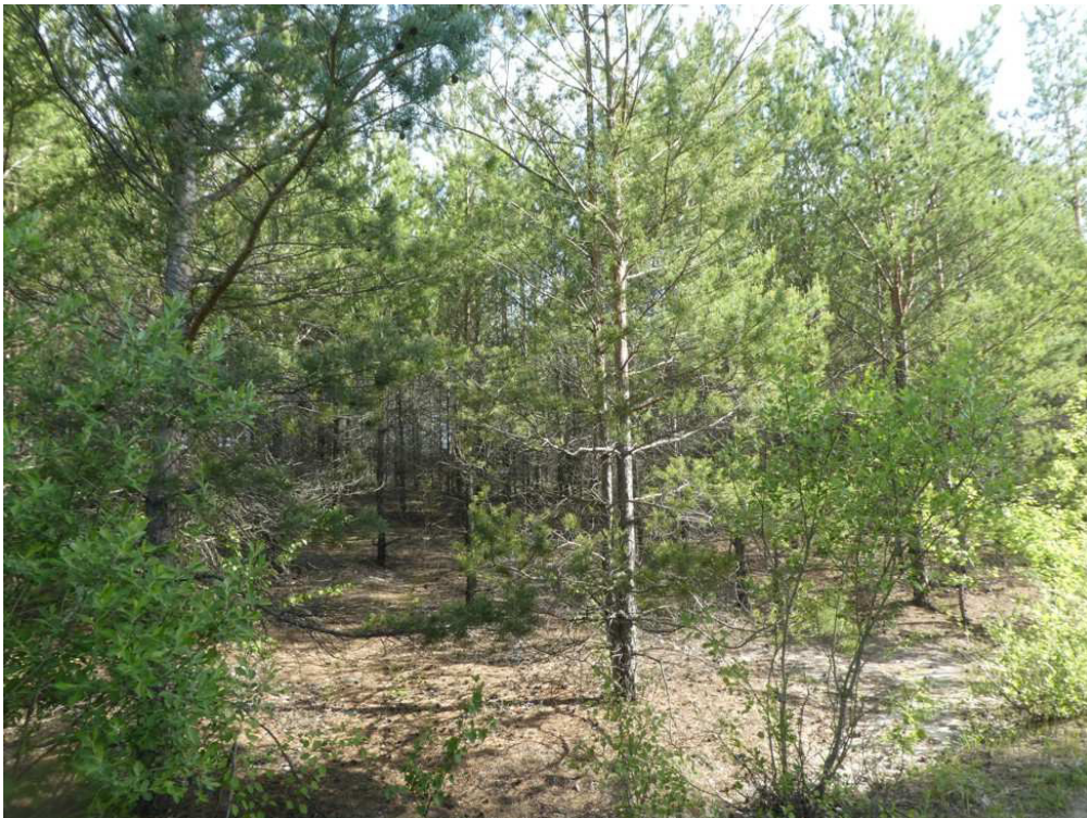
Foto 4. Monotone Kiefernauflastungen, angelegt in den 1990er Jahren, finden sich verschiedentlich am Rand der Freifläche (23.05.2022).

WEA des Typs „V80“ mit einer Nabenhöhe von 100 m und einem Rotordurchmesser von 80 m stehen im Windpark Klettwitz III (23.05.2022).