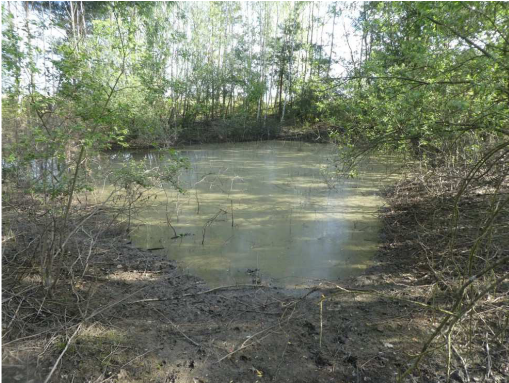
Foto 8. Das einzige dauerhaft wasserführende Gewässer ist im Untersuchungsgebiet ein von Gehölzen umschlossener Weiher am Ostrand des Baufeldes 3 (11.06.2022).