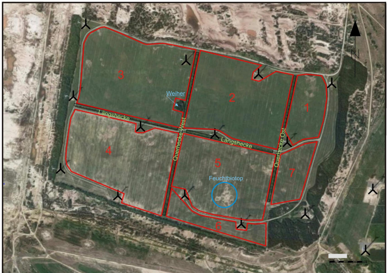
Abb. 2. Verteilung der untersuchten Baufelder 1 bis 7 mit den betriebenen Windenergieanlagen sowie der wichtigsten Geländestrukturen (Hecken, Weiher, Feuchtbiotop) im Luftbild.