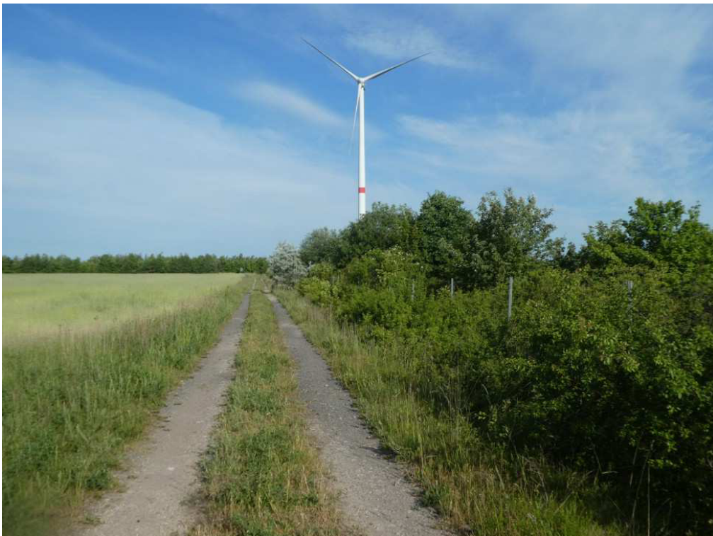
Foto 9. Schotterwege, hier entlang der „Längshecke“, erschließen das Untersuchungsgebiet (23.05.2022).

Die von Ost nach West orientierte „Längshecke“ ist 1.080 m lang. Die beiden anderen Hecken verlaufen in Nord-Süd-Richtung. Diejenige im Westen („Westhecke“) ist 900 m lang, die im Osten („Osthecke“) nur 690 m.