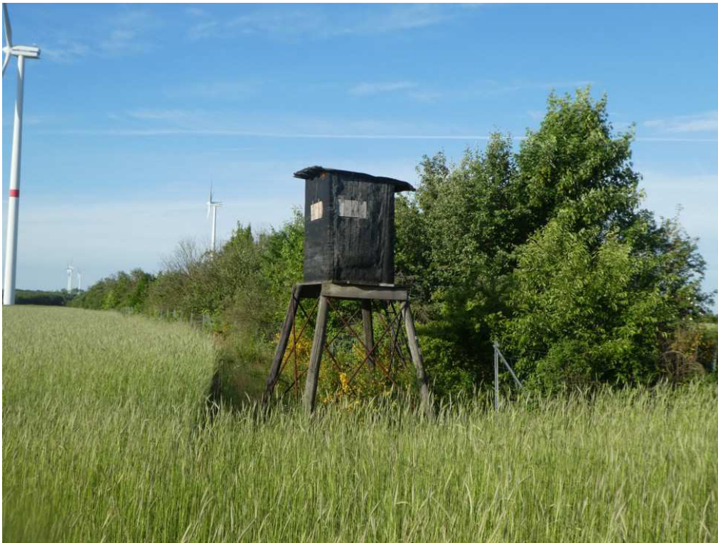
Foto 2. Rund 10 m breite Windstopperhecken aus verschiedenen Laubgehölzen, hier die Querhecke Ost, strukturieren die Freifläche (23.05.2022).

Seit dem Jahr 2003 befindet sich auf dem im Mittel 150 m ü. NN hoch gelegenen Areal (rund 140 ha) ein Windpark. Zunächst wurden im Winter 2003/04 zwölf WEA, eine weitere WEA dann im Dezember 2004 errichtet. Es handelt sich dabei um WEA der Baureihe „V 80“ (Nabenhöhe 100, Rotordurchmesser 80 m, Nennleistung 2 MW) (Abb. 1, Foto 3). Das Gelände unter ihnen wird landwirtschaftlich genutzt (Foto 1), wobei zahlreiche, etwa 10 m breite Heckenstreifen (Windstopperhecken) die Offenfläche strukturiert (Foto 2).