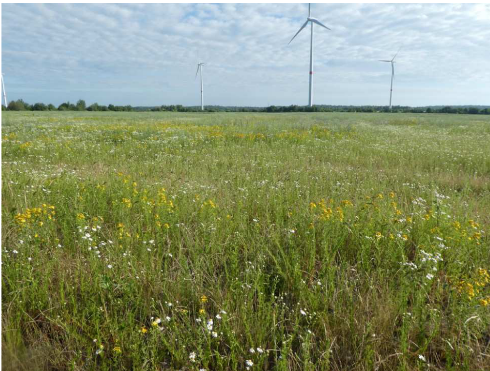
Foto 5. Die Baufelder 5 & 6 im Südosten des Untersuchungsgebietes prägt eine artenreiche Dauerbrache (11.06.2022).

Lediglich die Baufelder 5 & 6 (Abb. 2) wichen davon ab. Hier befand sich eine blütenreiche Dauerbrache (Foto 5) auf einer früheren Luzerne-Rotklee-Ansaat. Eingebettet in der Fläche 5 liegt ein größeres Feuchtbiotop, welches infolge des seit 2018 aufgelaufenen Niederschlagsdefizites allerdings kaum offenes Wasser aufwies (Foto 6). Ausgetrocknet waren auch zahlreiche Senken (Foto 7) auf den mit Roggen bestellten Flächen. In nassen Jahren dürften sie sich als Flachwasserbereiche präsentieren, was im Mai/Juni 2022 aber nicht der Fall war. Das einzige Gewässer des Untersuchungsgebietes ist ein von Gehölzen dicht umschlossener Weiher (Foto 8) am Ostrand des Baufeldes 3 (Abb. 2).