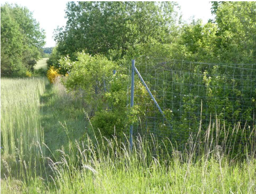
Foto 10. Obwohl seit vielen Jahren nicht mehr notwendig: gezäunte Hecke im Windpark Klettwitz III (23.05.2022).

Bezogen auf Wachtel und Rebhuhn sind die Wildzäune um alle Windstopperhecken (Foto 10) äußerst kritisch zu sehen. Sie sind seit vielen Jahren nicht mehr notwendig, aber für wildlebende Tiere sehr gefährlich. Zahlreiche Vögel fliehen bei einem Angriff durch Greifvögel, Eulen oder auch Bodenfeinden in Hecken und Büschen. Dabei verunfallen schlechte Flieger wie Rebhuhn und Wachtel nicht selten in solchen Wildzäunen, im Untersuchungsgebiet eine vermeidbare Unfallquelle!