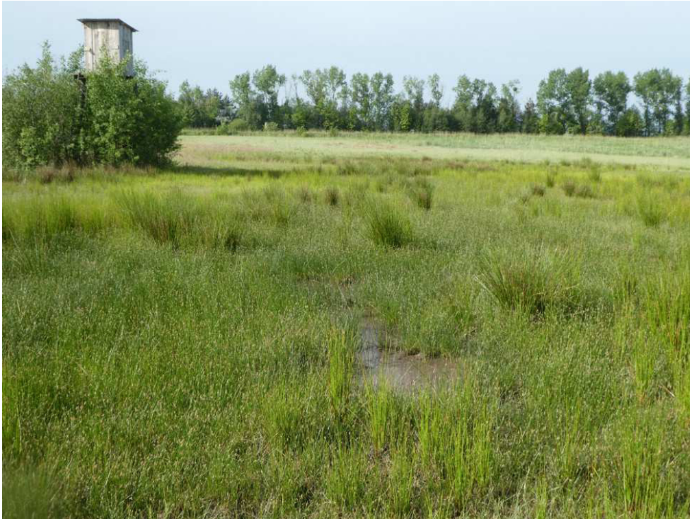
Foto 6. Infolge des Niederschlagsdefizites der letzten Jahre war das auf dem Baufeld 5 befindliche Feuchtbiotop im Frühjahr 2022 fast ausgetrocknet (23.05.2022).