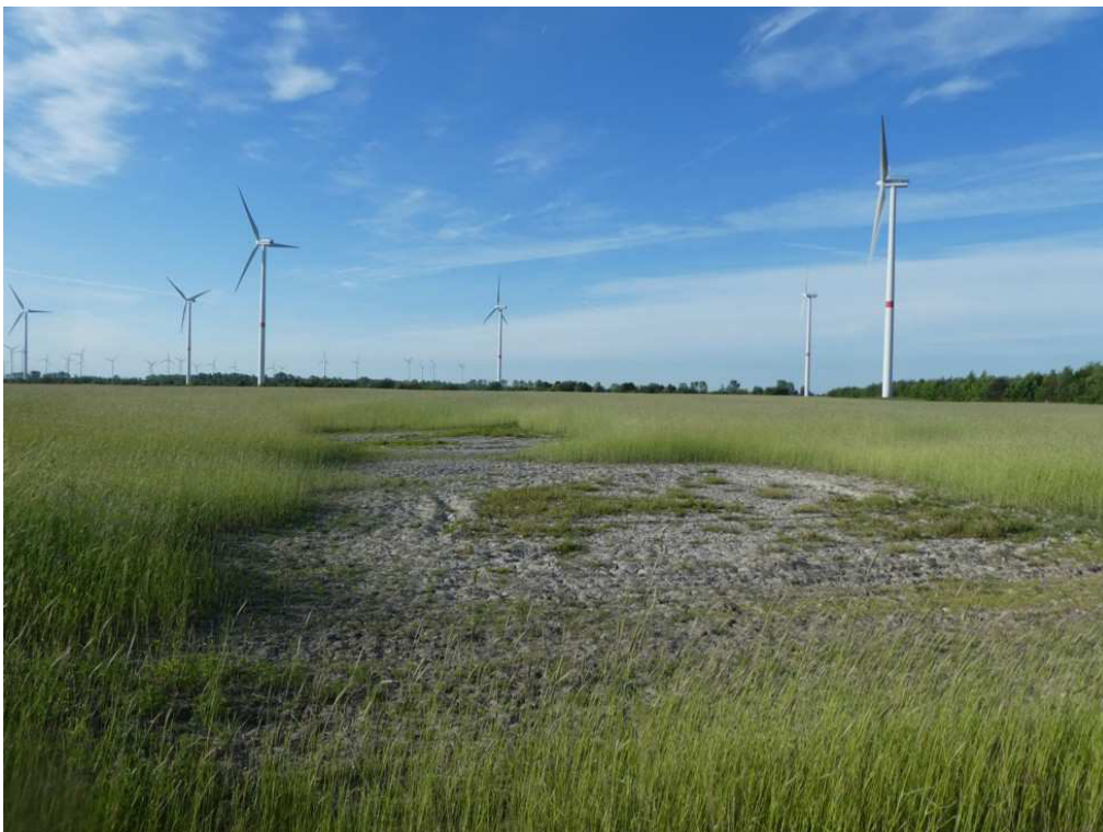
Foto 7. Zahlreiche Senken in den ausgedehnten Roggenfeldern präsentierten sich als Fehlstellen, im März/April befanden sich hier sicherlich noch Flachgewässer (23.05.2022).