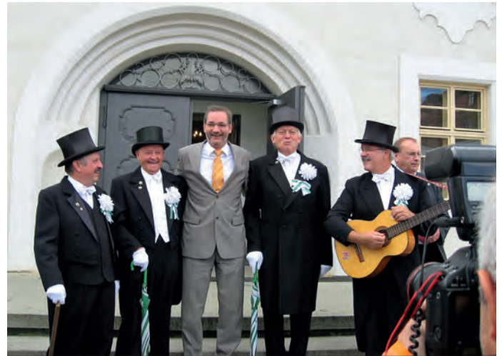
Matthias Platzeck noch als Ministerpräsident bei einem Besuch zum Sängerfest

Finsterwalde. „Umkehr zum Frieden“ heißt das Motto der Ökumenischen Friedensdekade, die im November dieses Jahres zum 40. Mal in Deutschland stattfindet, in Finsterwalde wird das Friedensfest zum 35. Mal gefeiert. Mehr als eine Woche lang finden vielfältige Veranstaltungen statt, Musik, Theater, Konzerte, Gespräche, Friedensgebete und auch die Geselligkeit kommt nicht zu kurz.