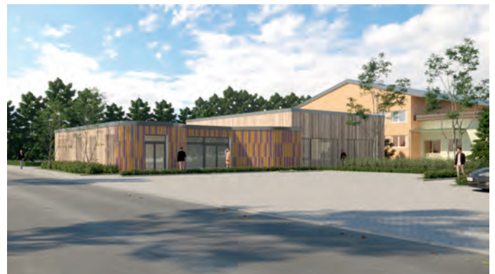
Entwurf Bürgerzentrum Crinitz

In der Gemeinde Crinitz wurde die Entwurfsplanung des Bürgerzentrums zum Abschluss gebracht. Die Gemeindevertretung entschied sich für die Variante eines Neubaus an der Turnhalle in der Pestalozzistraße. Die Baukosten für den Neubau werden aus heutiger Sicht mindestens 1 Mio. EUR betragen. Jetzt ist es Aufgabe der Verwaltung entsprechende Fördermittel zu akquirieren. Die Parkanlage am Crinitzer Waldbad wurde schon teilweise in Angriff genommen und soll 2021 fertiggestellt werden. Für den Spielplatz wurde ein neues Spielgerät angeschafft. Die vorgesehene neue Straßenbeleuchtung in Crinitz und Gahro konnte noch nicht realisiert werden. Die Ausführung ist im nächsten Jahr vorgesehen. Der Ausbau der touristischen Radwege in Richtung Schlabendorfer Felder beginnt noch vor Weihnachten und wird von der Stadt Luckau organisiert. Für die Dorfteichsanierung in Gahro ist ein Planer beauftragt, so dass auch 2021 mit dem Bau begonnen werden kann.