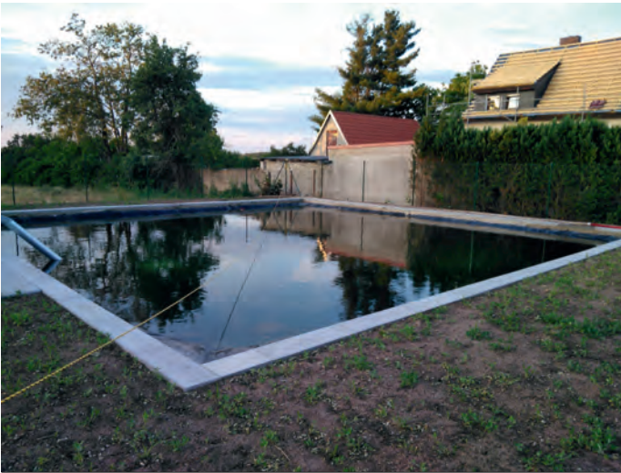
Löschteich in Sallgast