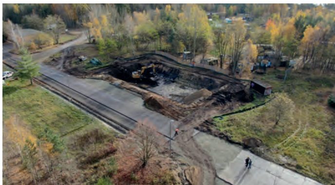
Strassenbau mit Löschteich am Bergheider See

veräußert werden. Ebenso in Lichterfeld, wo die Gemeinde allerdings nur die planungstechnischen Voraussetzungen schaffen brauchte. Wir freuen uns, dass durch Zuzug die Einwohnerzahl stabil gehalten werden können. Das Vereinshaus in Lieskau bekommt im nächsten Jahr die neue Überdachung.