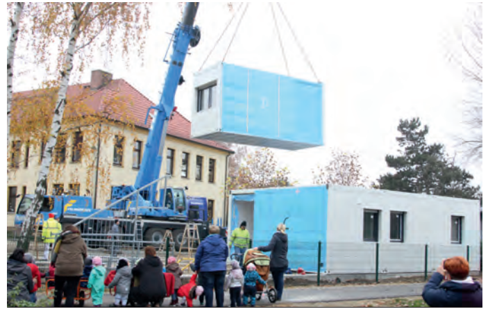
Montage Hort Massen