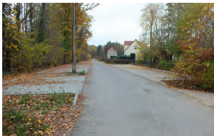
Parkplatz Klingmühler Straße

Die Gemeinde Sallgast hat leider keinen ausgeglichenen Haushalt, demzufolge lassen sich nur die Pflichtaufgaben und in geringem Umfang Investitionsmaßnahmen realisieren. Schallschutz in der Turnhalle, der Neubau eines Parkplatzes in der Klingmühler Straße und ein Regenwasserdurchlass in der Bahnhofstraße in Sallgast sind abgeschlossen. Die LED-Straßenbeleuchtung für Dollenchen ist noch in der Ausschreibung und wird 2021 realisiert. Für die elektronische Geschwindigkeitsanzeige an der Schule warten wir noch auf Fördermittel. Leider konnten wir den Straßenneubau von Göllnitz nach Zürcel nicht weiterverfolgen, da es einen Einspruch beim Land Brandenburg eines Mitgliedes der Gemeindevertretung gab. Da zu dieser Maßnahme ein eindeutiges Votum der Gemeindevertretung vorliegt, werden die Vorbereitungen weitergeführt.