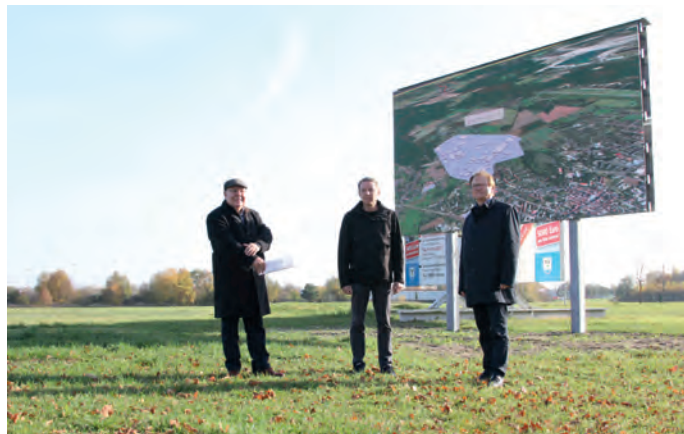
Gemeinde Massen wirbt jetzt digital

Die Gemeinde Sallgast hat leider keinen ausgeglichenen Haushalt, demzufolge lassen sich nur die Pflichtaufgaben und in geringem Umfang Investitionsmaßnahmen realisieren. Schallschutz in der Turnhalle, der Neubau eines Parkplatzes in der Klingmühler Straße und ein Regenwasserdurchlass in der Bahnhofstraße in Sallgast sind abgeschlossen. Die LED-Straßenbeleuchtung für Dollenchen ist noch in der Ausschreibung und wird 2021 realisiert. Für die elektronische Geschwindigkeitsanzeige an der Schule warten wir noch auf Fördermittel. Leider konnten wir den Straßenneubau von Göllnitz nach Zürcel nicht weiterverfolgen, da es einen Einspruch beim Land Brandenburg eines Mitgliedes der Gemeindevertretung gab. Da zu dieser Maßnahme ein eindeutiges Votum der Gemeindevertretung vorliegt, werden die Vorbereitungen weitergeführt.